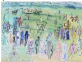
L'hippodrome de Deauville

Comparer le traitement des personnages avec celui de Raoul Dufy (1877/1953)