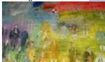
La fée électricité